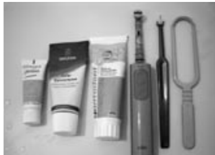
デンタル・グッズに凝ると丁寧に磨きたくなります。

治療をしに歯医者へ行くだけでなく、アドバイスを得ることで「虫歯予防」ができるのではないのでしょうか。市販されているたくさん歯磨き粉や歯ブラシの中から自分の歯形や歯の質に合ったものを教えてもらおう。そして注意が必要な箇所を磨き方を聞いたりする。健康な歯を維持していくことは体に栄養を与えていく上でとても重要なことなのです!