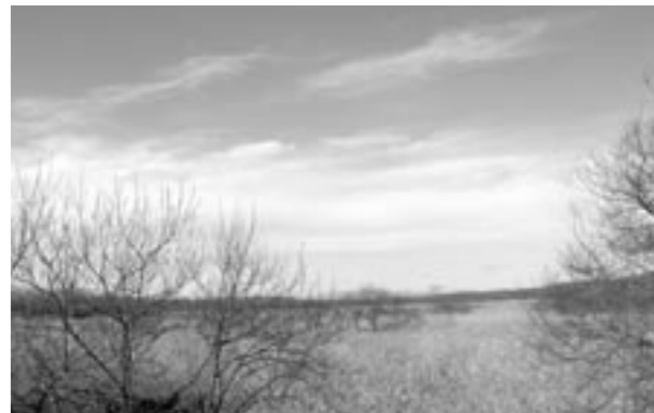
左：手前が風蓮湖、奥が海。／右上：動物の足跡、発見！なんだろう？／右下：風蓮湖の北にある茨散沼(ばらさんとう)。