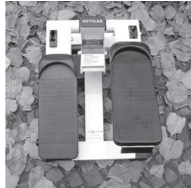
上：水中で泳いでいるペンギンよりも、丘にいるほうが私は好きです。 下：テレビを見ながら活用されていたと思われる……いったい誰が?